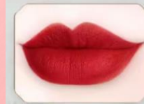
| 妆前薄涂 莹润饱满 |