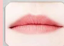
使用前效果: 嘴唇干裂起皮,唇色暗沉。