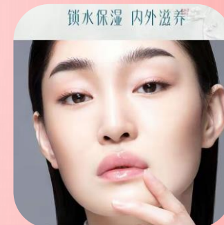
锁水保湿 内外滋养