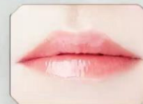
使用后效果: 软化角质,呵护唇部肌肤, 使之莹润饱满。